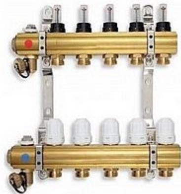
Hydroažuková charakteristika pro jeden výstup rozdělovače s průtokoměry

» A DOMOVSKÉ PRODUKTY » Podlahové vytápění