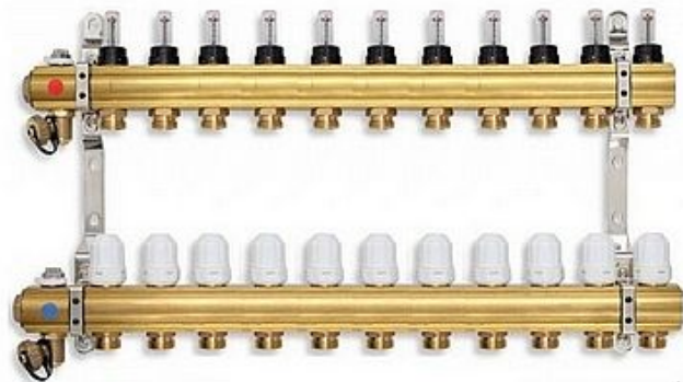
Hydraulická charakteristika pro jeden výstup rozdělovače s průtokoměry

» A DOMOVSKÉ PRODUKTY » Podlahové vytápění