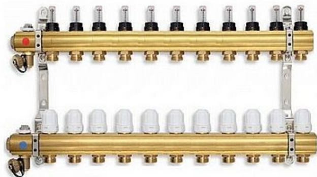
Hydrologická charakteristika pro jeden výstup rozdělovače s průtokoměry

» A DOMOVSKÉ PRODUKTY » Podlahové vytápění