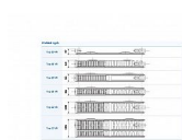
Způsoby připojení na otopnou soustavu