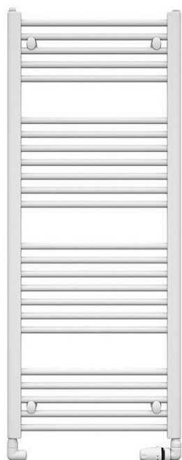
Způsob připojení KORALUX LINEAR CLASSIC

» Ohřev vody, topení » Koupelnové žebříky